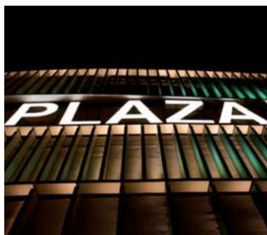
Die originelle Farbgebung der Lamellen, die je nach Blickrichtung an einen Regenbogen erinnert, zielt auf ein Spiel mit der Wahrnehmung.