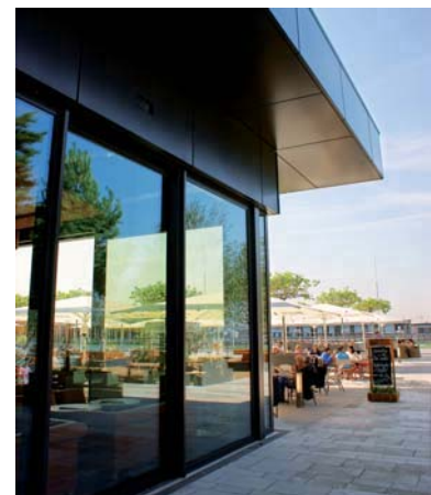
Alleinstellungsmerkmal: Das Flachdach wurde als „fünfte Fassade“ konzipiert und vervollkommen das ästhetische Gesamtkonzept.