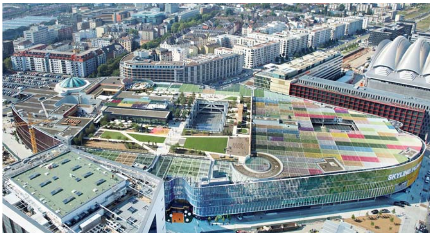
Das „Skyline Plaza“ fügt sich harmonisch in die Struktur des Europaviertels ein.

Jourdan & Müller greifen die Vielgestaltigkeit auf. Vor die innere Fassade stellen sie eine Gebäudehülle aus Streckmetall und Lamellen. Letztere folgen einem regelmäßigen Rhythmus, ihre Abstände sind aber von Stockwerk zu Stockwerk unterschiedlich breit. Die Stirnseiten der Lamellen sind verspiegelt und reflektieren die Umgebung. Die einen Längsseiten der Lamellen wurden koloriert, so dass ein Regenbogenfarbkreis das Gebäude einmal umläuft, die anderen Längsseiten wechseln von Weiß zu Schwarz. Je nach Blickwinkel ändert sich so die Anmutung der Mall.