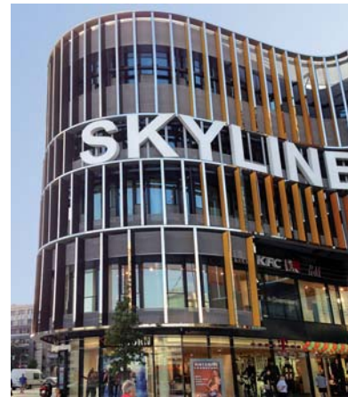
Unterstreicht das Lebendige der Bauform: die Lamellenfassade.

Die Grundform des fünfgeschossigen Gebäudes ist ein großes Oval. Das Tiefgeschoss ist als Parkfläche angelegt; das Erdgeschoss und das erste Obergeschoss beherbergen eine weitläufige