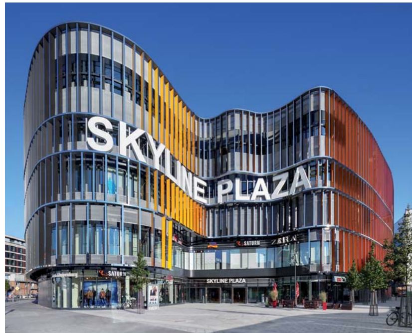
Die geschwungene Fassade und das markante Gestaltungsmerkmal: die farbigen Lamellen.

Das Architekturbüro Jourdan & Müller geht an Bauaufgaben nicht mit einem festgelegten Stilideal heran, sondern schafft Architekturen, die mit den Besonderheiten eines Standortes korrespondieren. Und genau mit dieser