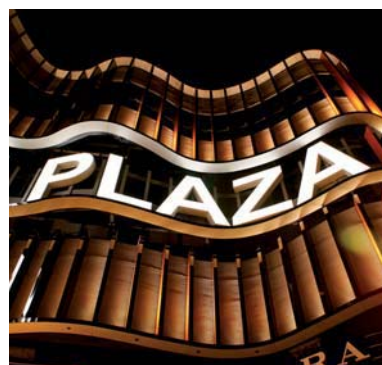
Die vertikalen Lamellen werden nachts durch energiesparende LEDs beleuchtet.