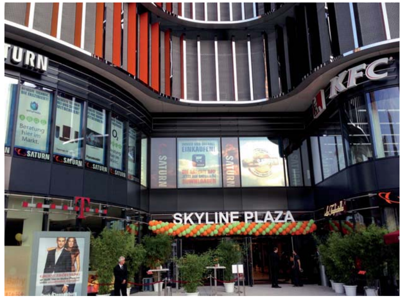
Zentral an der Europa-Allee gelegen: der Haupteingang des „Skyline Plaza“.

Unsere Aufgaben waren vielfältig: Im Bereich der Parkdecks verkleideten wir