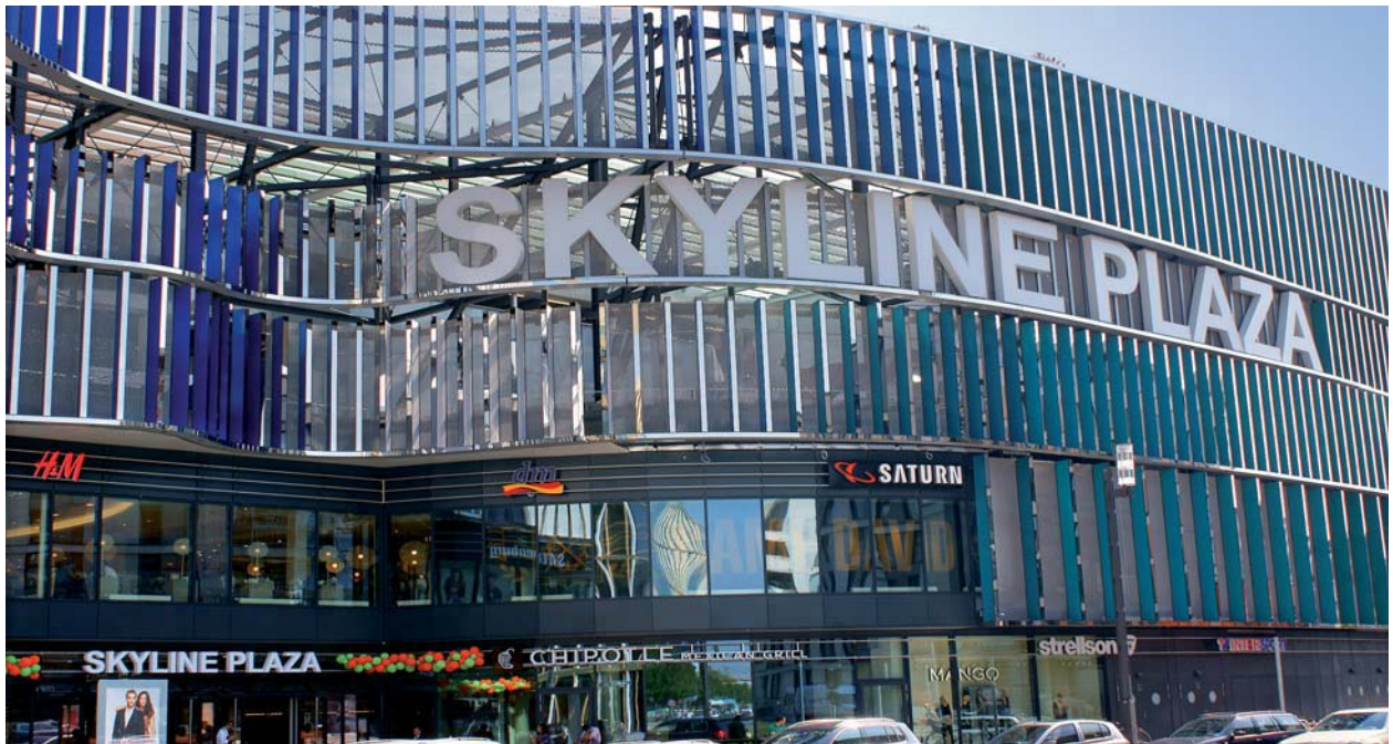
Wellenspiel mit Sogwirkung: Das Büro Jourdan & Müller setzt mit der Lamellenfassade des „Skyline Plaza“ unverwechselbare Akzente.

Das Europaviertel in Frankfurt/Main ist ein arriviertes städtebauliches Projekt. 2019 soll das riesige Areal fertig bebaut sein. Dann werden dort rund 10 000 Menschen wohnen und 30 000 Personen arbeiten. Die im August 2013 eröffnete Shoppingmall „Skyline Plaza“ wertet das neue Stadtquartier enorm auf.